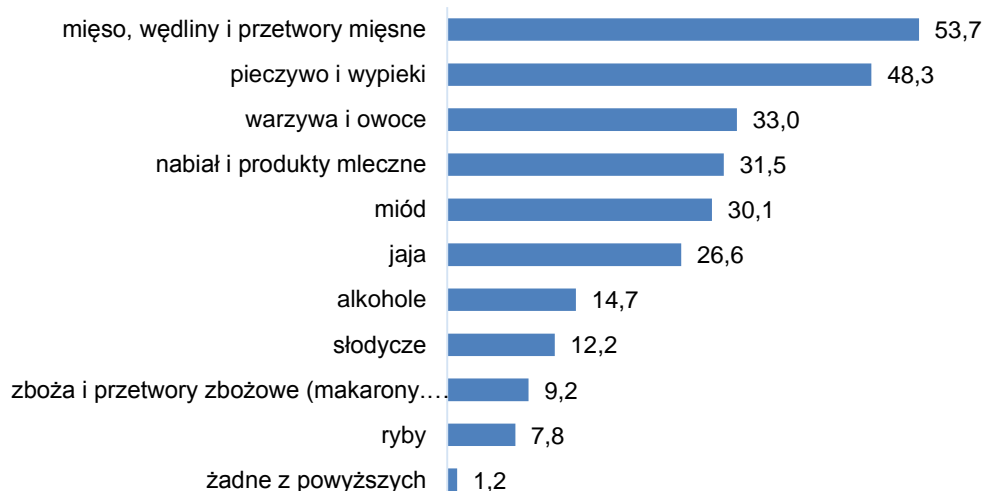
Rys. 3 Które Pan/Pani zdaniem polskie produkty są lepsze od produktów zagranicznych? Można wybrać 3 kategorie.

Dla prawie połowy respondentów informacja o braku konserwantów byłaby przekonująca do zakupu danego produktu spożywczego. 44% ankietowanych zwraca uwagę na wysoką jakość, a 40% - na brak modyfikacji genetycznych. Niemal żaden z respondentów nie wskazał na certyfikaty, czy znak jakości.