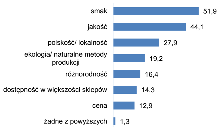
Rys. 2 Jakie są Pana/Pani zdaniem największe zalety polskiej żywności? Proszę wskazać max. 2 odpowiedzi.

Ponad połowa ankietowanych uważa, że polskie mięso, wędliny i przetwory mięsne są lepsze od produktów zagranicznych. Niewiele mniejszy odsetek wskazuje na pieczywo i wypieki (48%), a co trzeci badany - na warzywa i owoce.