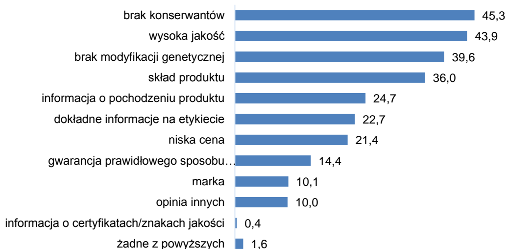
Rys. 4. Jaka informacja przekonałaby Pana/Panią do zakupu danego produktu spożywczego? Proszę wskazać 3 najważniejsze aspekty.

Polacy doceniają wysoką jakość produktów także za pomocą portfela. Ponad 60% ankietowanych jest w stanie zapłacić więcej za żywność wysokiej jakości. Ponad 80% respondentów wybrałoby polski produkt zamiast zagranicznego, gdyby był w tej samej cenie.